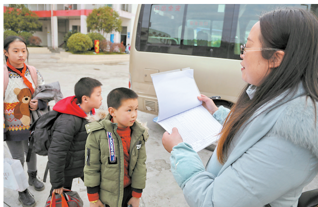
放学后,学生在指定线路红领巾专车前排好队,值班教师认真核对花名册后,学生有序上车。

“家长省钱、省力、省心,企业实现精准批量营运使客座率提升,学生上下学安全隐患有效消除。”在胡永生看来,“红领巾专车”服务实现了企业“增利润”、家长“降支出”、学校“消隐患”的三赢局面,“我们将进一步总结试点的经验,结合‘两项改革’中的群众需求,让农村学生上下学更加安全、快捷与便利。”