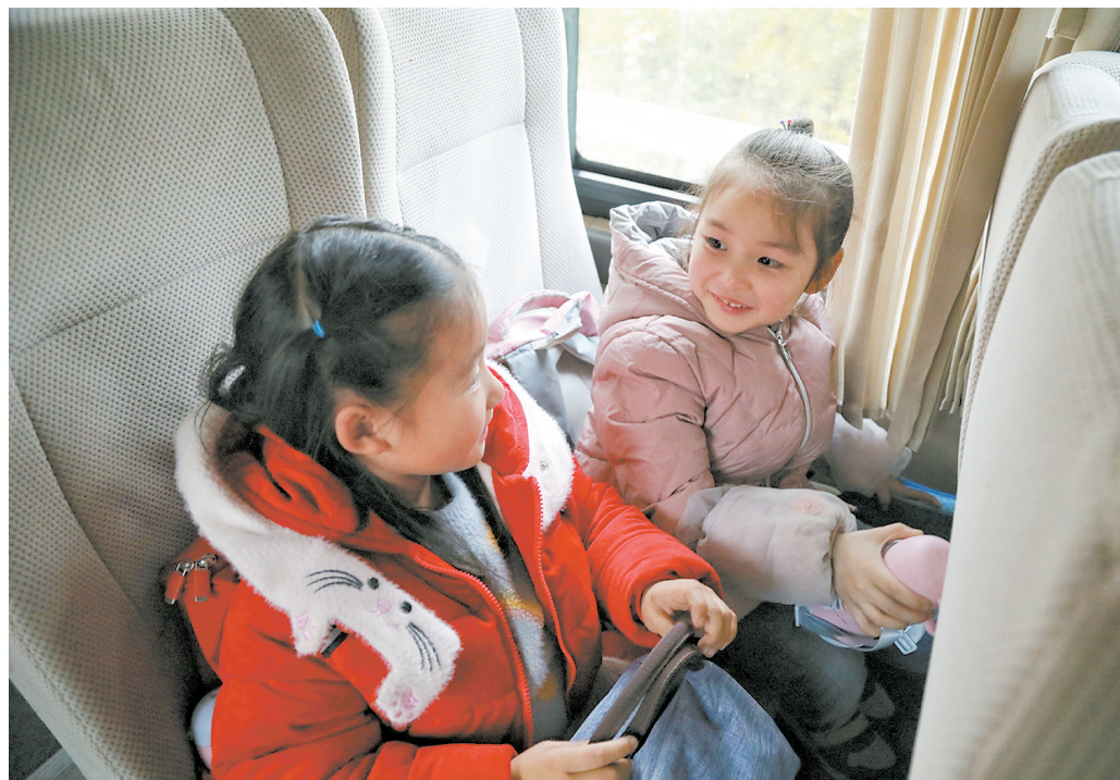
坐上“红领巾专车”,孩子们脸上笑开了花。