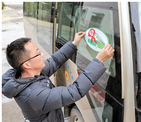
专车使用前,西平小学教师张贴“学生定制客运”的标示