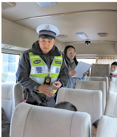
西平镇派出所民警上车排查安全隐患