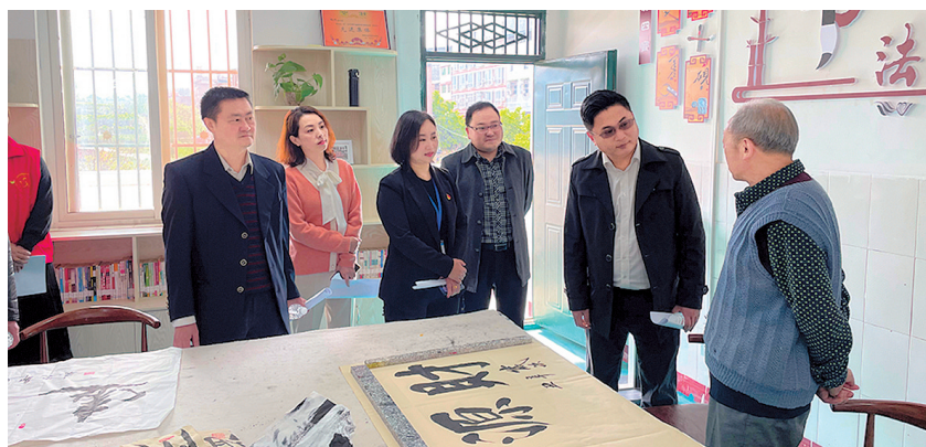
4月16日,调研组在绵阳市游山区魏城镇桂花社区开展家庭教育工作调研。

一是要完善机制,为各部门、学校、社区间的工作做好协调配合,顶层上有设计,方向上有引领;二是各层机构各司其职,落实好自身工作的同时主动对外合作,不能只靠校长和老师自己的一腔热血支撑;三是参与家教工作的一切人士,都要立足于家长的需求开展工作,为家长提供真正有效学习的平台,不论是理论层面还是实操层面,无论是线上还是线下。