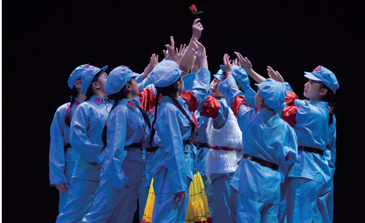
天全县始阳第二小学戏剧节目《风中的索玛花》。