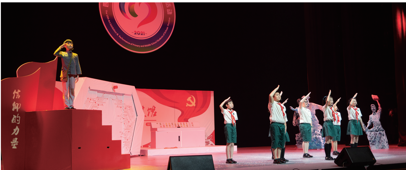
宜宾市戎州实验小学节目《我知道》,让“小萝卜头”与同龄人相遇。

近年来,我省围绕学生全面发展,以提高学生审美和人文素养为目标,切实发挥课堂教学主导地位,抓住实践育人关键,坚持面向人人、全员参与,逐步形成“教会、勤练、常展演”的教学机制。全省现有校级艺术团超过6.2万个,每年举行校级以上艺术活动超过2.3万场次,艺术活动学生参与面达87.12%。建立了省、市、县三年一届中小学生艺术展演活动,校级每年一次综合性艺术展演活动的常态化机制,“一校一品”和“一校多品”的美育发展新格局逐渐形成。