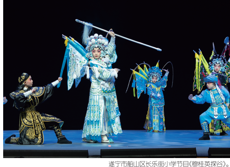
遂宁市船山区长乐街小学节目《穆桂英探谷》。