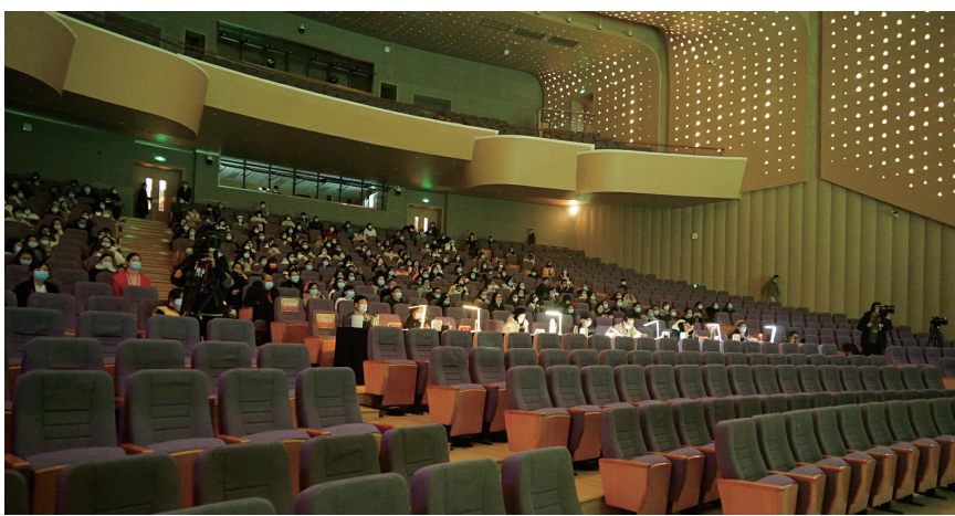
展演活动严格控制观摩人数,评委和观众间隔就座。