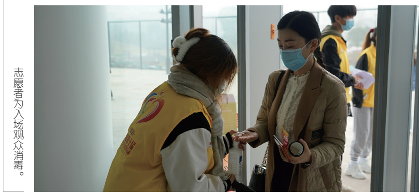
志愿者为入场观众消毒。