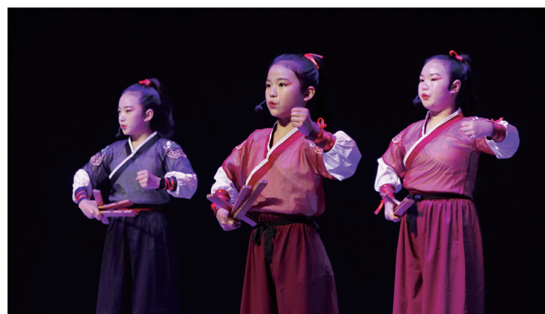
大英县隆盛镇小学节目《壮士出川》。