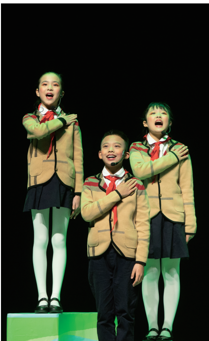
成都市龙江路小学分校节目《樱花五线谱》。

12月24日至26日,四川省第十届中小学生艺术展演活动(朗诵、戏剧专场)在自贡举行。本届展演活动以“阳光下成长”为主题,坚持以社会主义核心价值观为引领,大力弘扬中华优秀传统文化,厚植爱国情怀,培养民族情感,坚定文化自信。展示活动还融入建党100周年主题,坚持落实立德树人根本任务,通过现场展示活动开展党史学习教育,引领当代青少年学生树立远大志向、培育美好心灵,践行永远跟党走的理想追求。