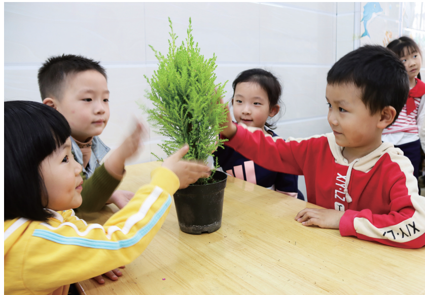
小萌娃学绿植

三是管理防疫(Management)。营造整洁温馨的幼儿园环境,做到处处无卫生死角。对园所环境严格进行清洁消毒。开展防疫应对实操演习,增强师幼自我保护意识,同时每