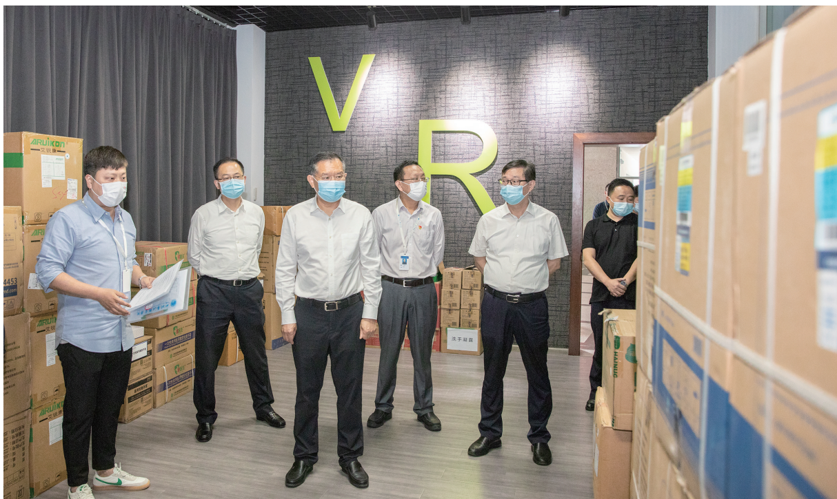
李建国(左三)在四川长江职业学院防疫物资库房,察看学校防疫医疗物资储备情况。

在成都医学院,李建勤实地察看了学生常态化核酸检测开展情况,听取学校应急演练、医疗物资储备等工作汇报,叮嘱学校要抓实抓细,通过应急演练锻炼队伍,提升能力,及时发现、补齐短板;随后走进师生食堂,与学生交流,询问相关防疫措施、食品安全落实情况,详细了解应急生活物资储备、应急机制建设等情况。