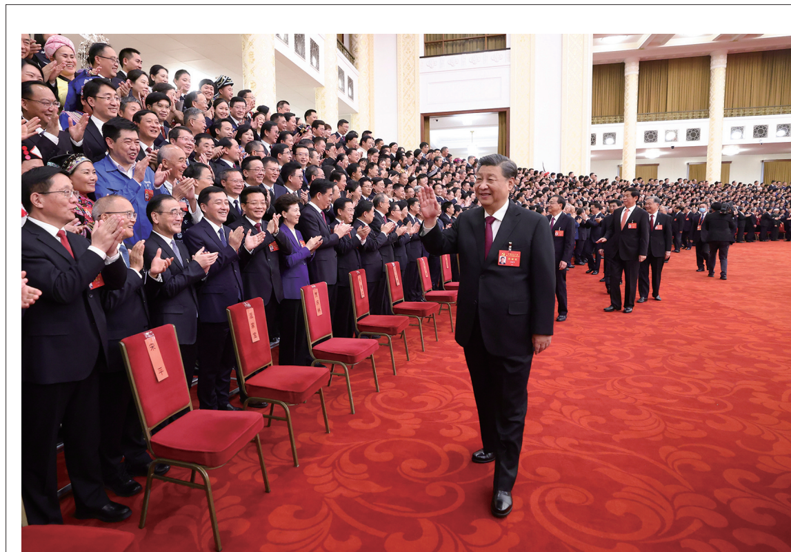
10月23日下午,中共中央总书记、国家主席、中央军委主席习近平等领导同志在北京人民大会堂亲切会见出席党的二十大代表、特邀代表和列席人员,并同大家合影留念。