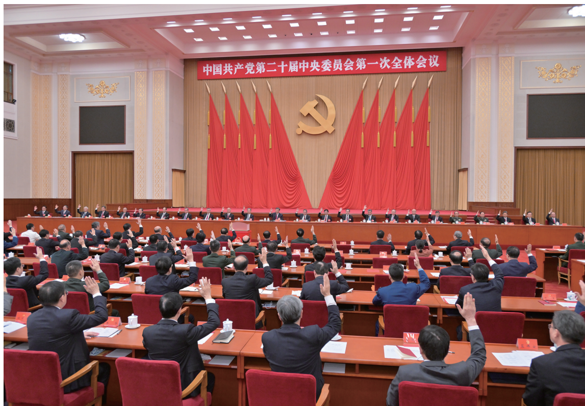
左图:10月23日,中国共产党第二十届中央委员会第一次全体会议在北京人民大会堂举行。习近平同志主持会议并在当选中共中央委员会总书记后作重要讲话。