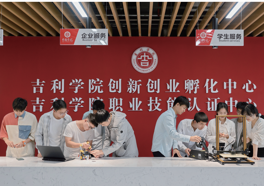
学生在创新创业孵化园进行孵化项目论证。

党的二十大报告强调,坚持科技是第一生产力、人才是第一资源、创新是第一动力,深入实施科教兴国战略、人才强国战略、创新驱动发展战略,开辟发展新领域新赛道,不断塑造发展新动能新优势。创新驱动发展战略需要创新型人才,而高校是创新型人才成长的重要平台。