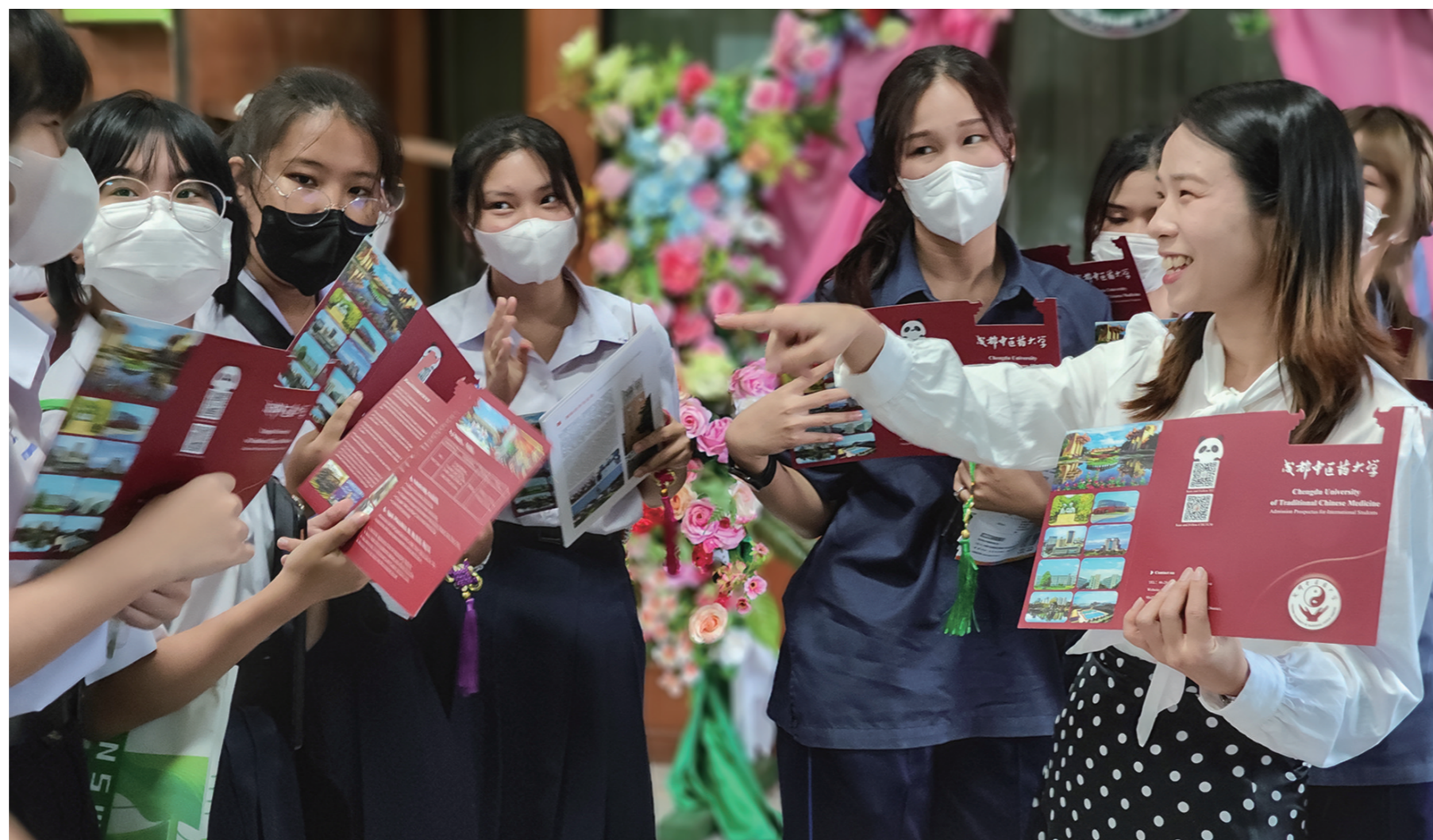
在泰国曼谷萨拉维他雅学校,前来参加“魅力四川澜湄行”高等教育展(曼谷站)学生正与成都中医药大学教师交流互动。

“随着中国现代化进程的推进,我相信高等教育国际化程度将越来越高,我们也将吸引更多外国学生来川留学。”省委教育工委副书记、“魅力四川澜湄行”代表团团长刘立云说,本次高等教育展活动是四川省教育厅主办的一项全国性教育展览活动,旨在积极响应国家“一带一路”倡议,推动澜湄教育合作,向东南亚国家介绍四川经济社会发展情况,特别是四川的教育改革发展成果,进一步增进友谊和相互了解,促进交流合作。