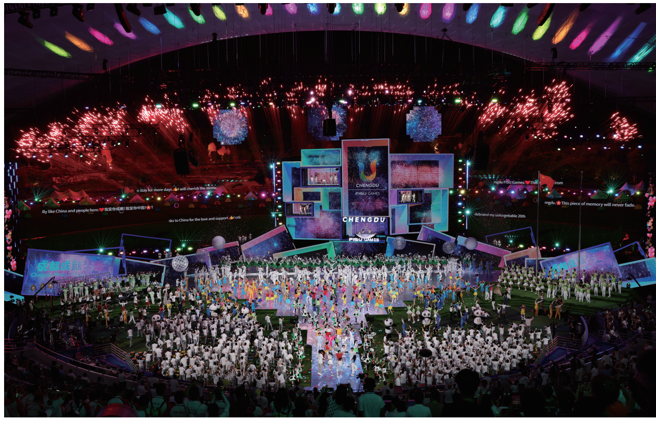
8月8日晚,第31届世界大学生夏季运动会闭幕式在成都露天音乐公园举行。

国际大体联代理主席艾德致辞,高度评价成都大运会的组织工作。他说,参与世界大学生运动会远不止为了运动成绩,更是为了收获一段经历、一段可能持续一生的友谊。最后,艾德宣布