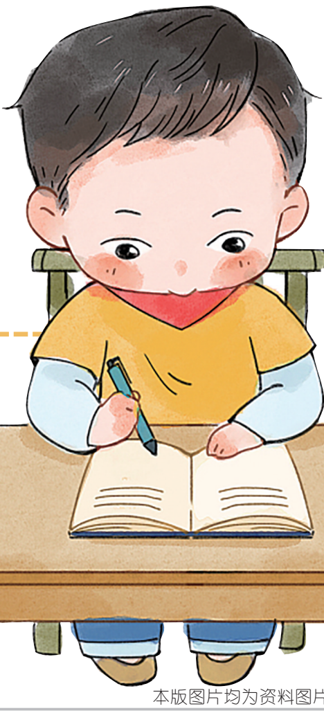
本版图片均为资料图片

爷爷的手艺名不虚传，是难得的奇人。作者不仅因爷爷的手艺敬佩，更敬佩爷爷的自信、对生活的满足。