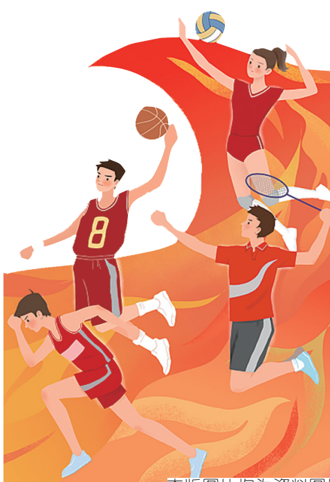
本版图片均为资料图片

文章语言表达准确，实验的过程描写得干净利落，作者紧紧抓住人物的心理描写和神态描写，细致入微，让作文更加生动有趣。