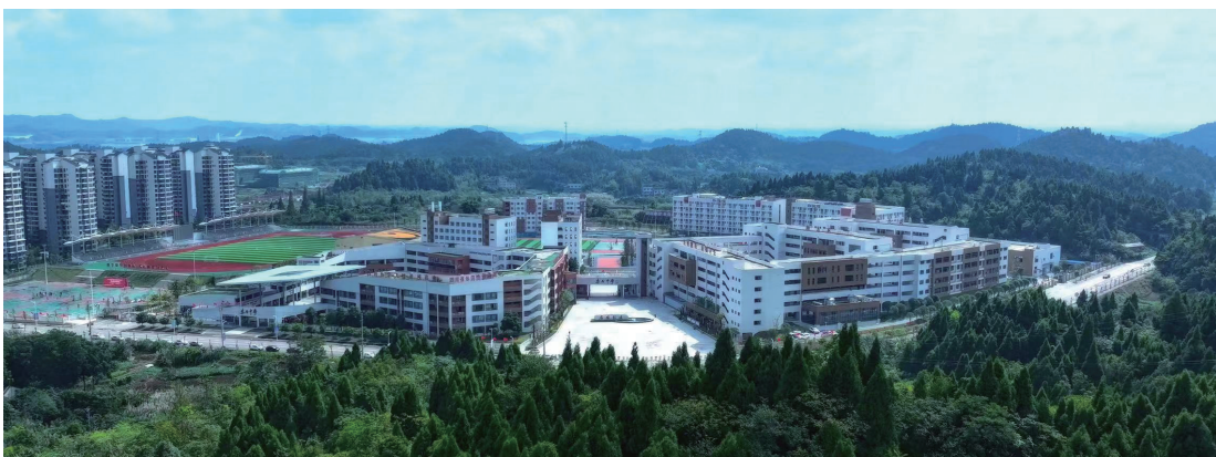
安居中学校园

遂宁市安居区,一个年轻的城区;四川省安居中学,一所年轻的学校。10年前,安居城区无公办高中,乡镇高中办学质量无法满足群众需求,民办学校学费昂贵,老百姓迫切需要一所优质的公办高中。