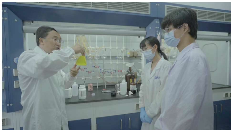
冯小明院士在实验室指导学生实验。