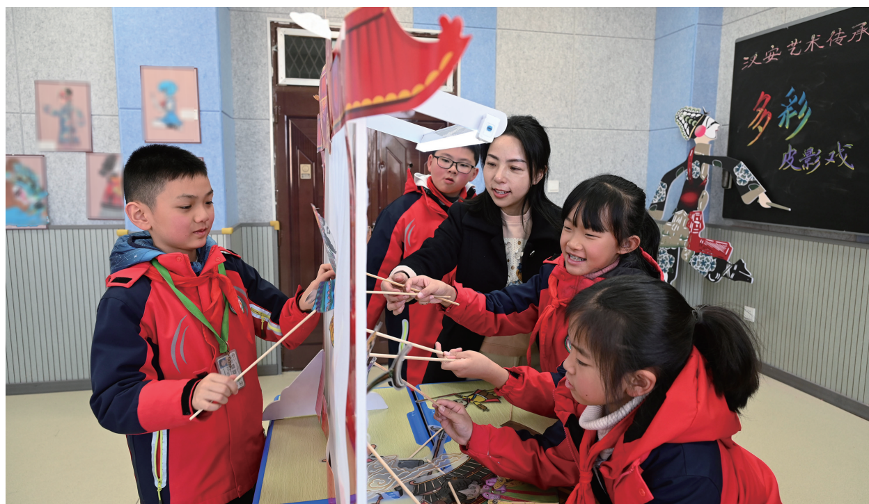
在内江市东兴区外国语小学,老师指导学生学生学习皮影戏表演技艺。