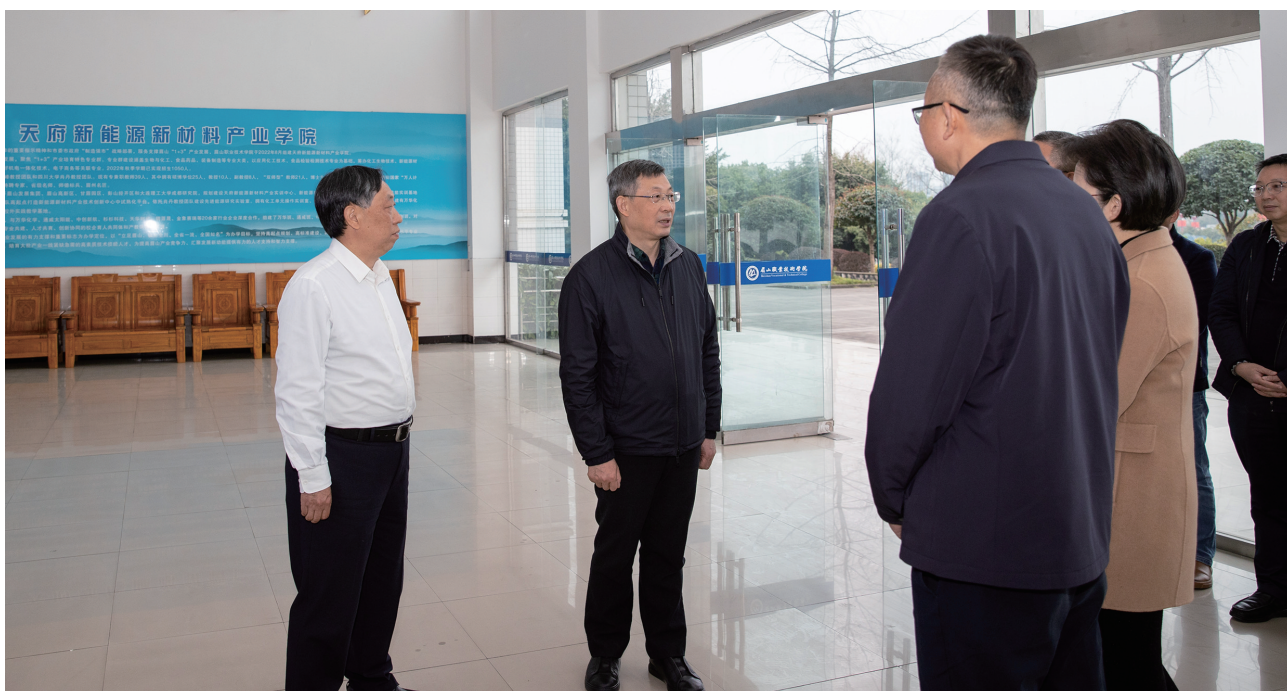
在眉山市职业技术学院教学大楼,余孝其(左二)听取学校产教融合工作开展情况,了解学校围绕产业办专业、服务地方经济发展的做法与成效。

余孝其首先来到眉山市新能源新材料融合创新中心,实地调研了产教融合与科技创新情况。随后,他来到眉山职业技术学院天府新能源新材料产业学院,与学校负责人及相关专业带头人仔细交流,当得知学院与近10家行业龙头企业合作组建学徒班时,余孝其要求学院紧盯产业链条、企业需求、市场信号、政策框架、技术前沿等,深化产教融合校企合作,加强实习实训基地建设和教育教学改革,推进“双师型”教师队伍建设和人才培养质量,助力地方经济社会发展。眉山中学是省一级示范性普通高中,一直秉持“传承苏风,懿德启智”的办学理念。余孝其走进校园,听取学校办学情况介绍,了解寒假期间