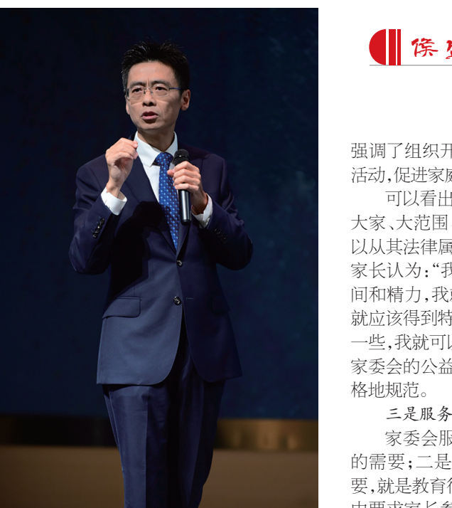
首先,家长和学校要从法律的角度,了解家委会的几个法律特征。

关键词二:回归。 1952年教育部《小学暂行规程(草案)》、2010年《国家中长期教育改革和发展规划纲要(2010—2020年)》、2012年《教育部关于建立中小学幼儿园家长委员会的指导意见》(以下简称《指导意见》)、2017年教育部发布《中小学德育工作