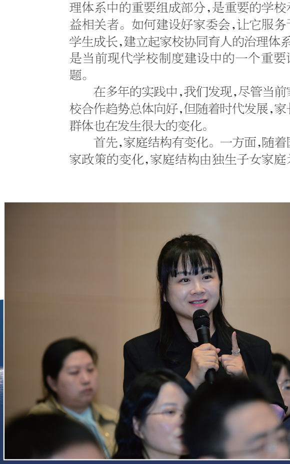
活动现场 家长代表与教育专家互动。