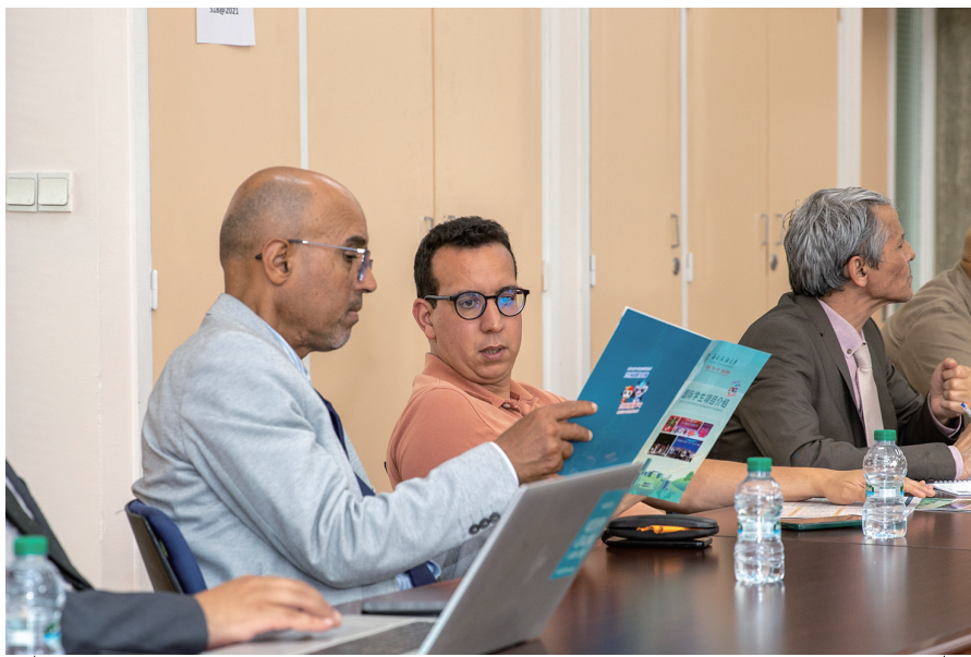
当地时间6月5日下午,四川高等教育代表团访问摩洛哥拉巴特国家高等矿业学校,会上,外方教师认真阅览我省高校招生宣传材料。