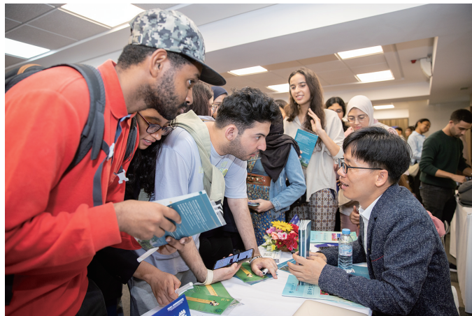
当地时间6月7日下午,“魅力四川”高等教育展在摩洛哥拉巴特中国文化中心举行,摩洛哥学生在西南石油大学展台前咨询来川留学相关问题。