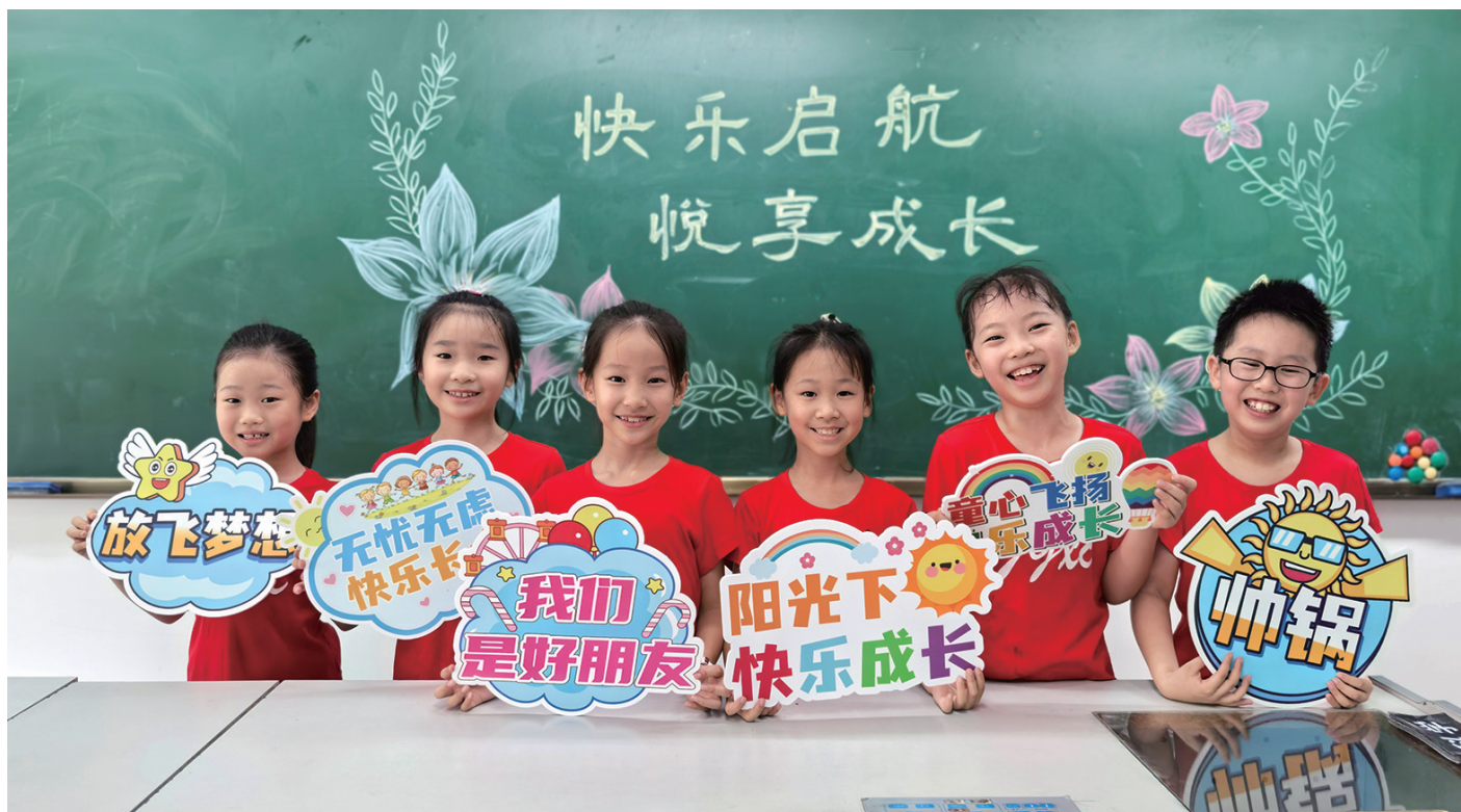
成都市锦官新城小学学生开学报到。

近日,成都市各中小学陆续开学,不少学校精心策划了充满仪式感的迎新活动和开学仪式,让学生以崭新的姿态迎接新学期。