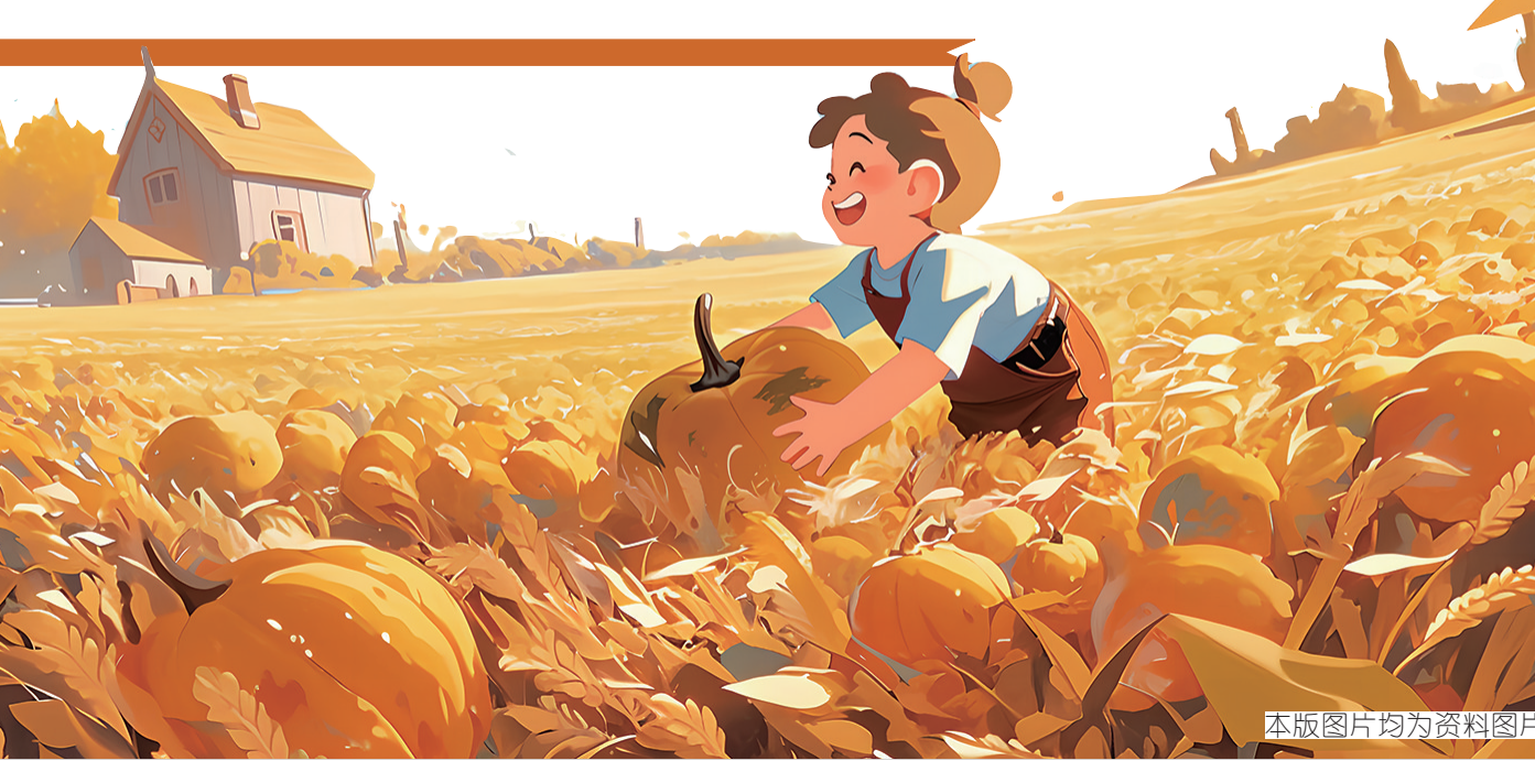
本版图片均为资料图片