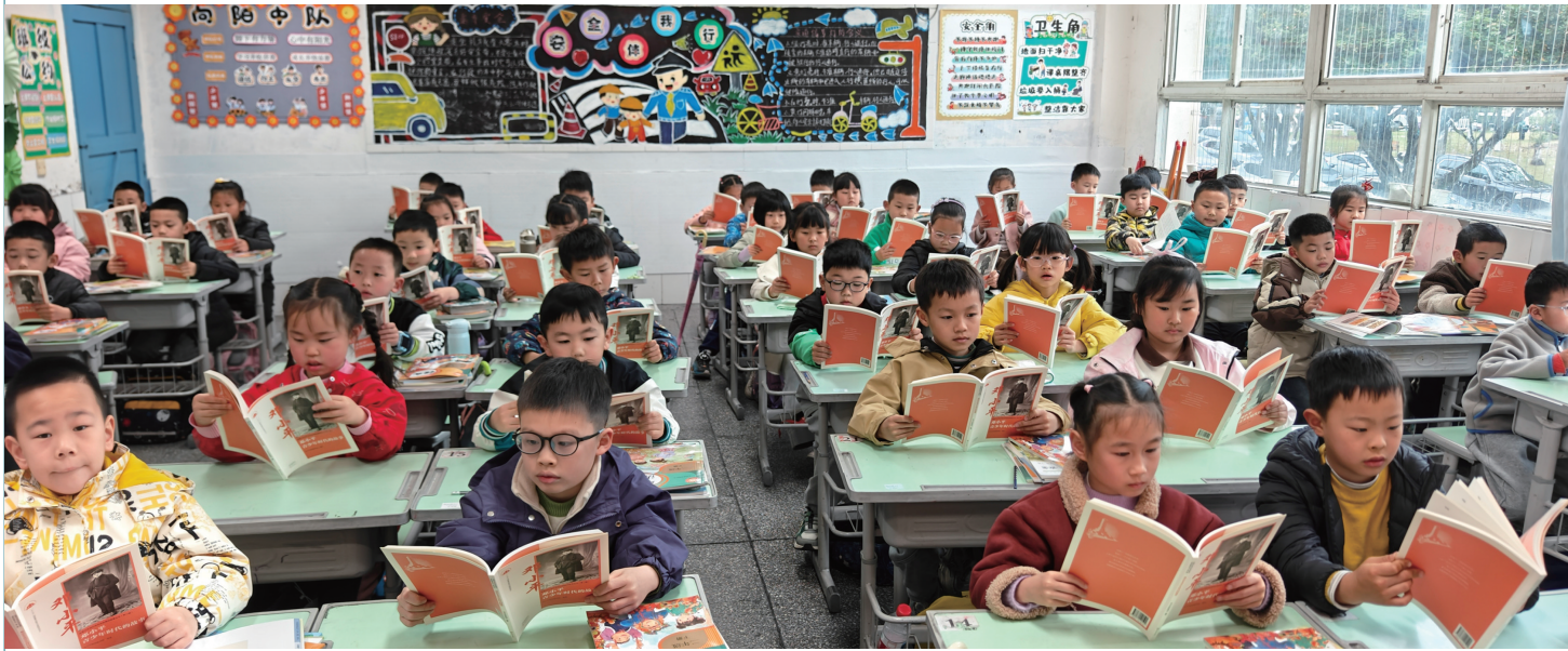
广安市广安区希望小学校二(7)班阅读课场景。