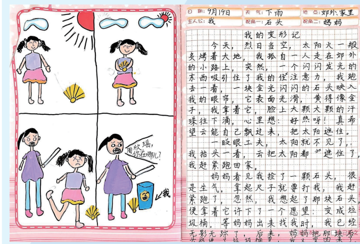
学生完成的写绘作品分为图画和习作两个部分。